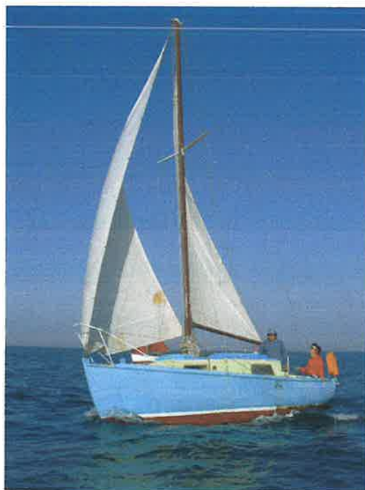
Sa première sortie lointaine et avec la femme du patron à la barre. Tout un symbole.

Puis un certain nombre d'équipières, plus nombreuses et certaines peu aguerries ... Enfin, les toutes aussi courageuses accompagnatrices, supportrices et fidèles à toutes les arrivées au ports, rassurantes.