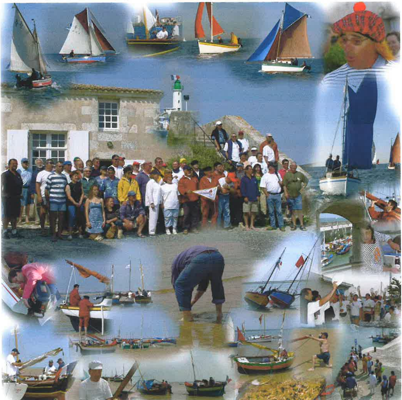
Un aperçu de toutes les photos prises à l'île de Ré

Bureau et conseil d'administration s'organisent pour mettre l'information à votre disposition.